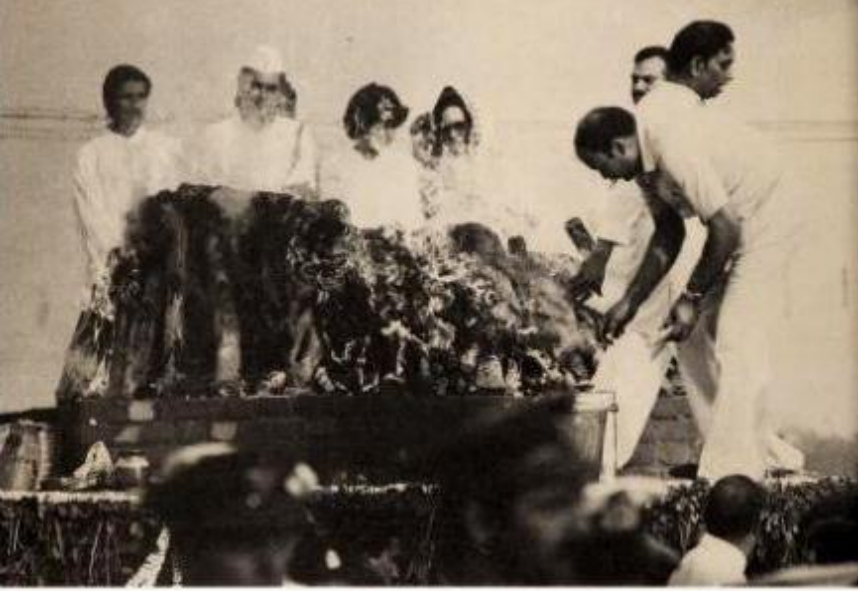
(वर) इंदिरा गांधी यांच्यावर अंतिम संस्कार होताना. (खाली) भारतीय लोकांनी श्रीमती गांधी यांच्या अंतिम संस्कारावेळी मोर्चा काढला.